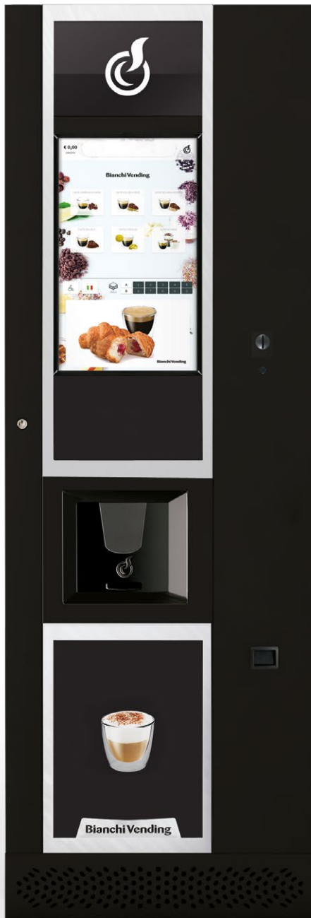
LEI600 TOUCH 21*

LEI600, distribuidor automático de bebidas calientes con capacidad de 600 vasos y panel de selección directa con 24 selecciones (versión Easy y Smart). Diseñado para intercambiar fácilmente el panel de selecciones y adaptarse a diferentes ubicaciones.