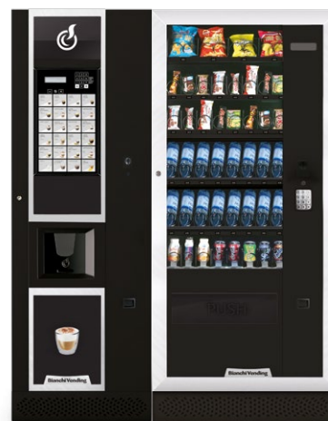
LEI600 SMART + ARIA L MASTER